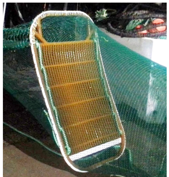
Figur 1: Krepsehullet i nedkant av rekerista.

Forsøkene ble utført ombord på rekefølgeren "Camo" i området sør og øst for Færder fyr. Totalt ble det gjort 18 hal, fordelt på tre tokt i hhv mars, april og november. Fartøyet fisket med to identiske, kommersielle tråler rigget som dobbeltrål. I begge trålene var det montert inn